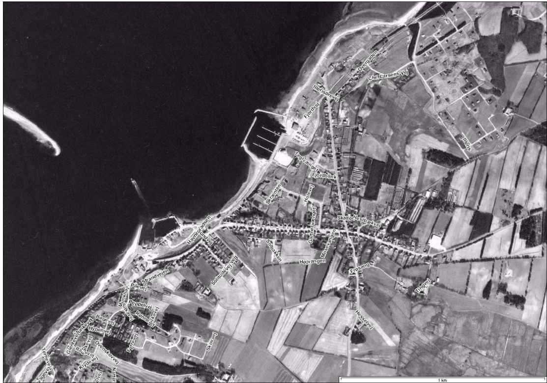
Hvalpsund, luftfoto 1975.