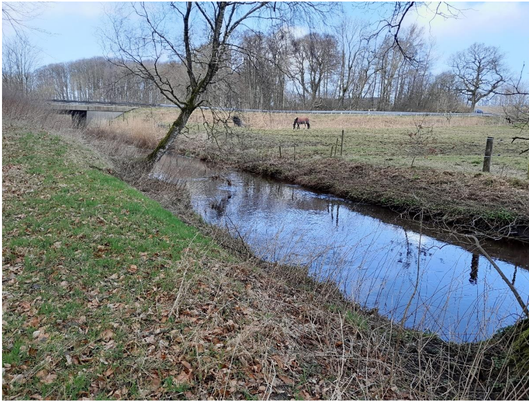
Figur 1 Foto af sydlig brink (venstre), hvor isætningsstedet skal etableres. Foto taget mod nordvest.