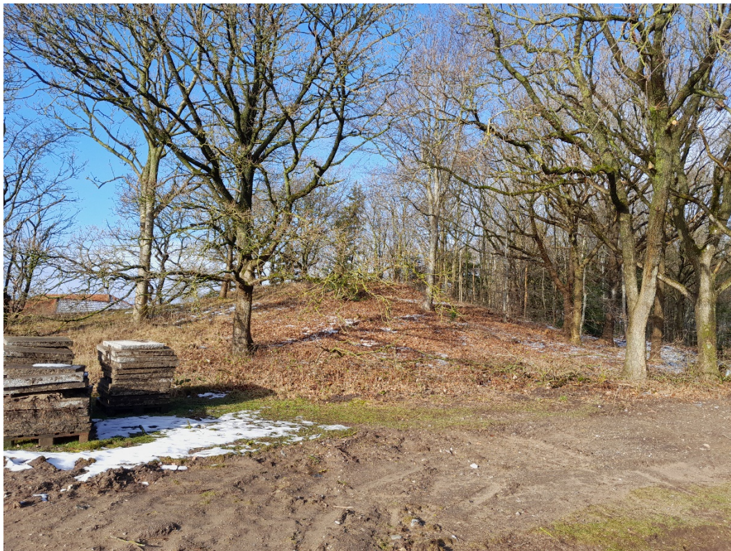
Figur 1 Foto af gravhøj fra Bakkegårdsvej. Foto taget mod nordvest

Gravhøjen er træbevokset (se figur 1). Tæt på gravhøjen ligger henholdsvis Bakkegårdsvej (mod øst) og Baldersvej (mod syd), hvorfra man primært oplever gravhøjen. Fra gravhøjen ser man ud mod et eksisterende boligområde mod vest, syd og et industriområde mod øst. Mod nord er der ingen bebyggelse men ældre træopvækst.