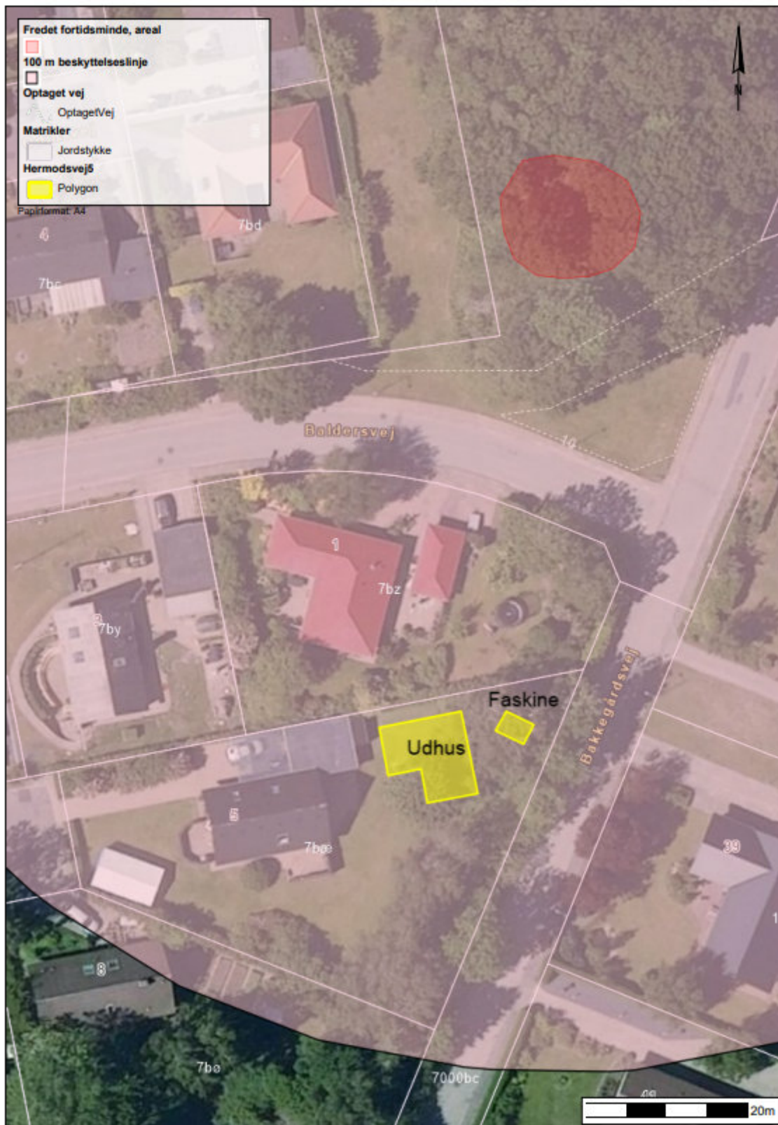
Figur 5 Kort over fortidsmindebeskyttelseslinje (markeret med lyserød), gravhøj (markeret med rød) og udhus og faskine (markeret med gult)