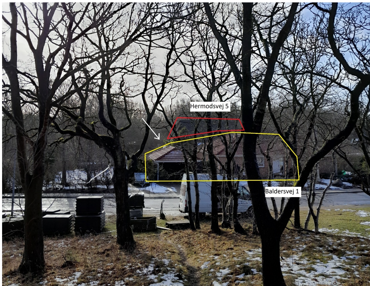
Figur 2 Foto fra gravhøj mod sydvest. Baldersvej 1 er markeret med gult. Udhuset placeres bag carporten (markeret med en hvid pil). Ejendommen på Hermodsvvej 5 anes bag huset på Baldersvej 1 og er markeret med rød.