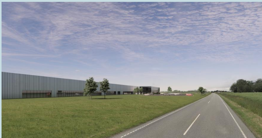
Eksempel på hvordan området kan komme til at se ud fra Nordre Ringvej.

Mod vest og syd grænser projektområdet således op til erhvervsejendomme. Mod syd findes desuden et større grønt område med skovbeplantning. Sydvest for projektområdet findes parcelhuskvarteret ved Birkevej. Mod vest grænser projektområdet i øvrigt op til landbrugsarealer. Mod nord afgrænses projektområdet af Nordre Ringvej.