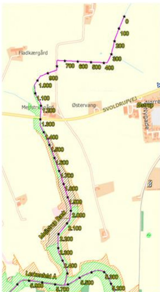
Figur 3.5 Mejlstrup Bæk, § 3 beskyttede naturområder (grøn = engarealer, brun = mose, blå = sø, lilla = hede, orange = overdrev).