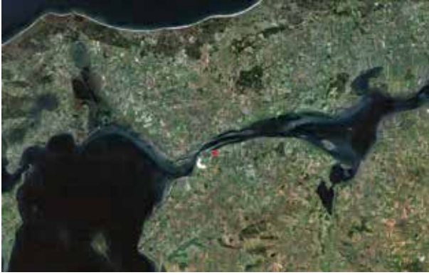
LAND midt i det udstrakte landskab Nørrekærønge ved Limfjorden