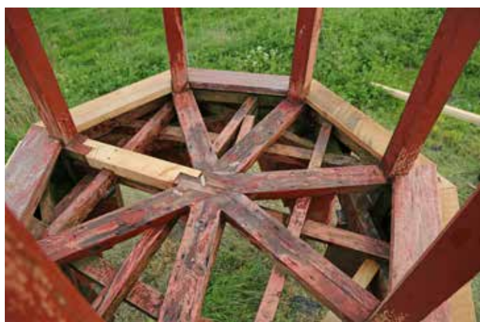
Vedligeholdelse og reparation