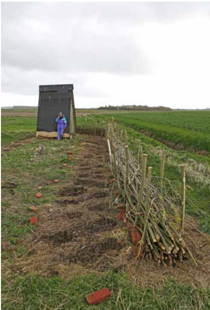
Anlæg til permakulturel skovhave med kvashegn og beplantning af Sødebær