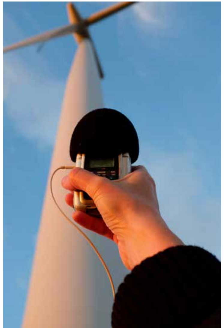
Lyden af en vindmølle