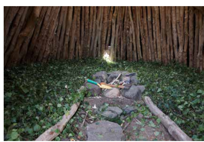
Nyt frisk duftende birkeløv i gammen