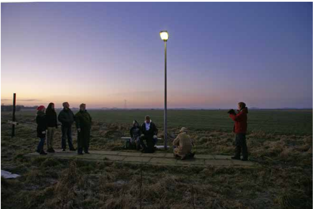
På det populære Fortov eller stoppestedet under gadelampen, hvor mange gode diskussioner og møder har udspillet sig mens vi venter på ...