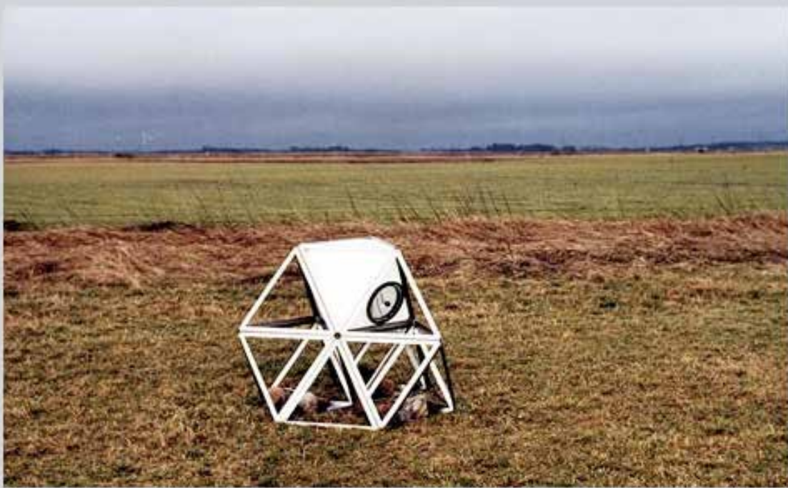
Position: N 56° 59' 55" E 009° 19' 33,7". Area: 625 m2. Løgstør, Denmark.

Stelen er opstillet af kunstnergruppen N55 i 2000 på LAND, som del af et internationalt landart-projekt, 17 steder i verden, der er tilgængeligt for alle. LAND på Nørrekær Enge har positionen N 56° 59' 55" E 009° 19' 33,7" og har et areal på ca. 650 m2.