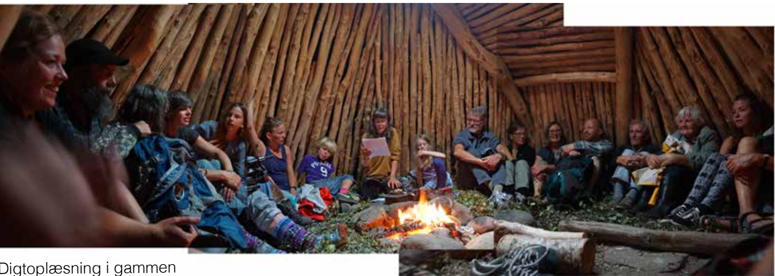
Digtoplæsning i gammen