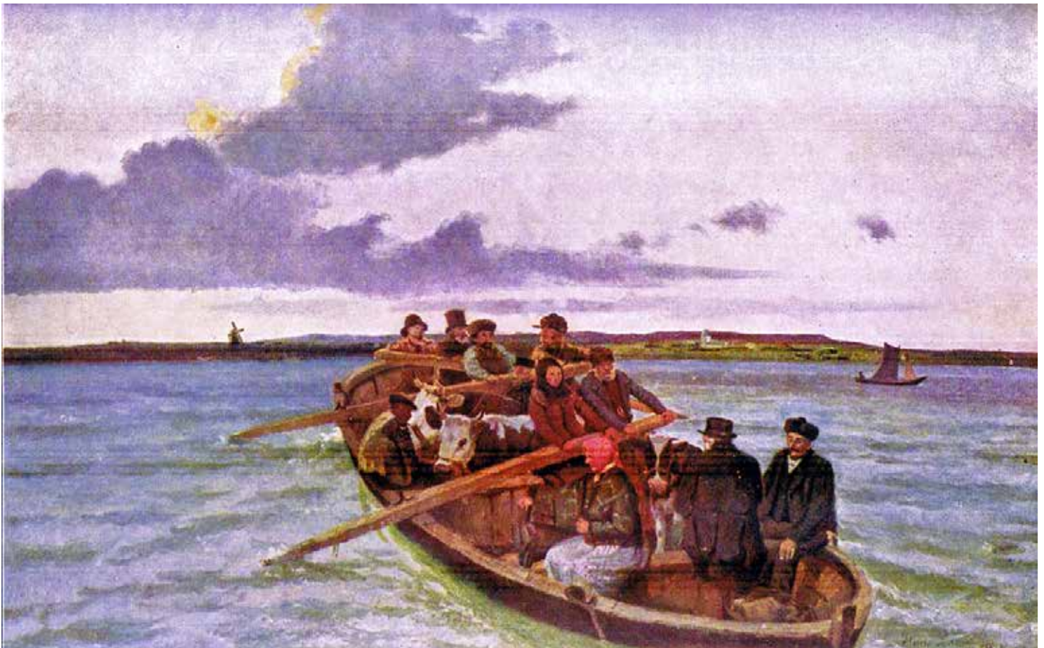
Maleri af Hans Schmidt: Færge over Limfjorden, 1920, Inspiration til Bienale projekt til Nørrekærbiennalen 2019